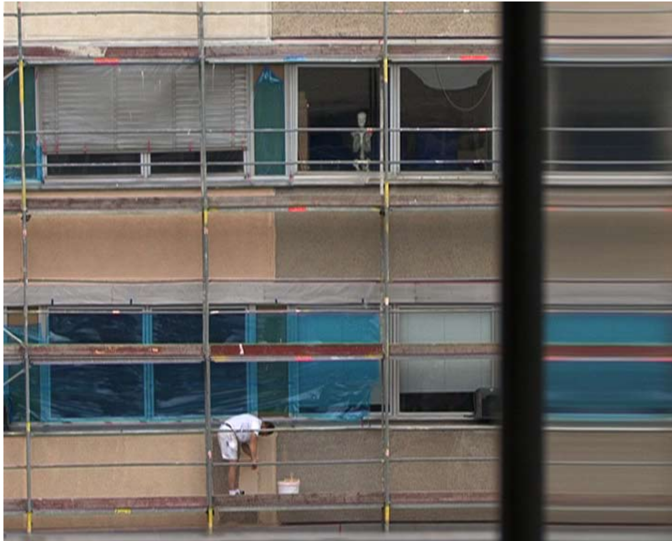
JA / NEIN _ Ansicht 04. Dresden 2008. Stills. Digitales Video (DV-Cam) / DVD. Stumm. 7 min. Loop