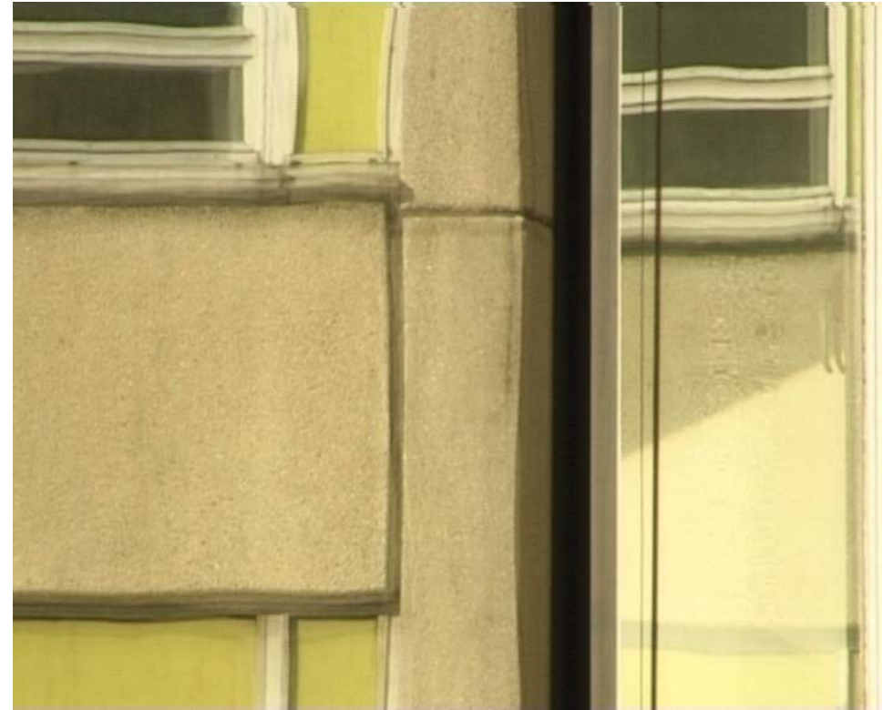
Fensterverspiegelung V. Dresden 2001 Stills. Digitales Video (DV-Cam) / DVD. Stumm 5 min. Loop