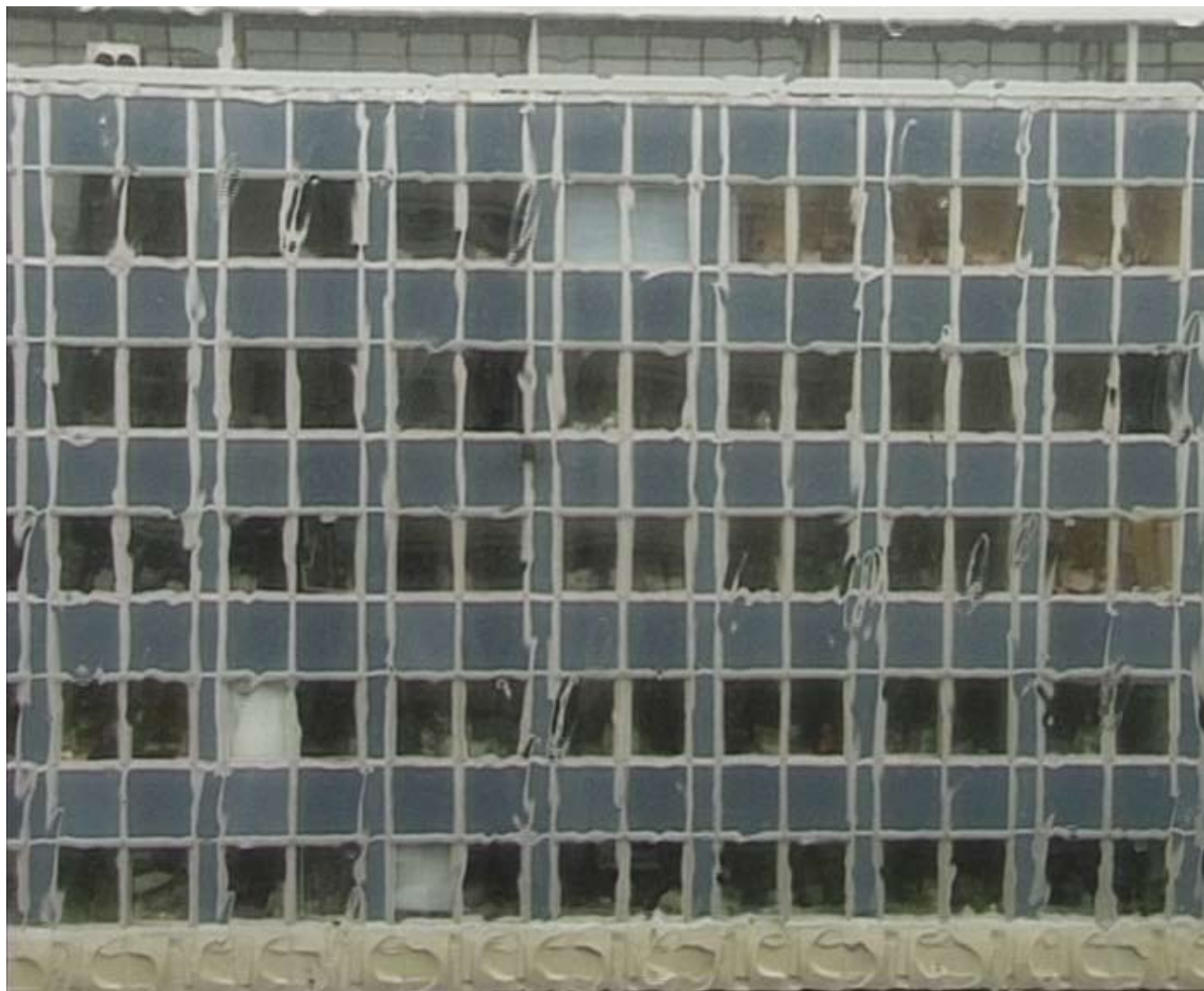
Regen I. Dresden 2002. Still. Digitales Video (DV-Cam) / DVD. Stumm. 5 min. Loop